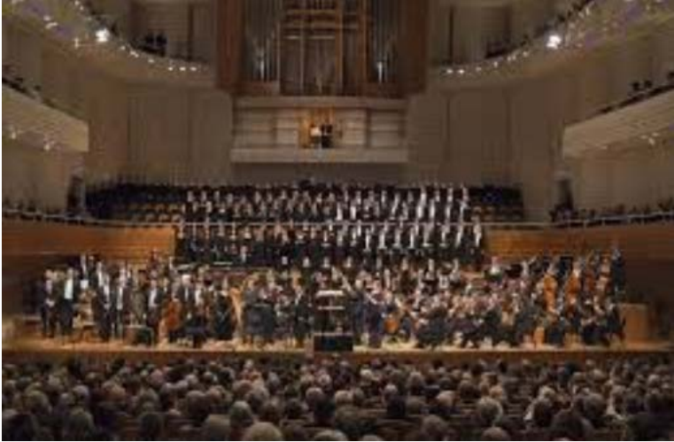
Lucerne Senfoni Orkestrası ( LSO) evleri Konser/Kongre Merkezinde