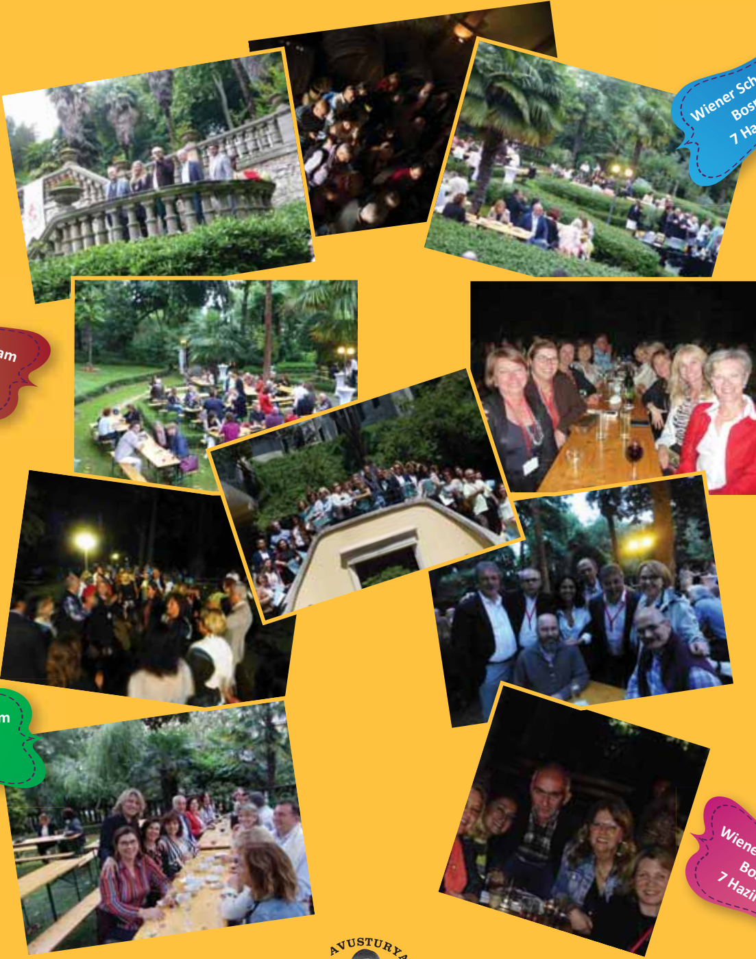
Wiener Schnitzel am Bosphorus 7 Haziran 2014